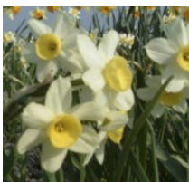
Minnow , Tazetta Narzisse

Eine hübsche Rarität in dunkelvioletter Pracht setzt im Garten schöne Akzente. Blüht lange und zuverlässig in Beeten zwischen Stauden, als Farbtupfer unter Gehölzen und natürlich auch in Gefäßen.