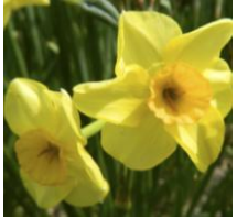
Golden Dawn , Jonquilla Narzisse

Diese Mininarzisse ist eine zierliche reichblühende Schönheit mit zartem Duft. Sie freut sich über einen Platz am Rand oder als Unterpflanzung von Gehölzen und vermehrt sich dort fleißig.