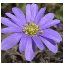
Anemone blanda, 'Blue Shades' , Balkan Windröschen

Sie gedeiht in feuchten Magerwiesen und an anderen Stellen, die im Sommer nicht zu stark austrocknen.