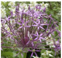
Allium christophii , Sternkugellauch

Die Blüten des Goldlauch, duften zart nach Lilien. Ursprünglich kommt er aus den Pyrenäenwäldern und liebt etwas feuchten Boden. Er ist gut zur Verwilderung unter Gehölzen geeignet oder zusammen mit Wildstauden.