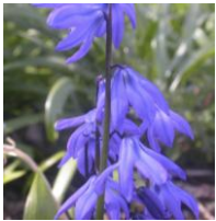
Scilla siberica , Sibirischer Blaustern

Sternförmige blaue Blüten mit weißem Inneren. Eine Wildart, die sich über Samen vermehrt. Mit der Zeit entstehen so ausgedehnte Flächen von diesen Frühlingsboten. Macht sich auch gut in Steingärten.