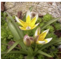
Tulipa tarda , Wildtulpe

Frühblühende Zwiebelpflanzen sind wertvolle Trachtpflanzen für Wild- und Honigbienen an den ersten sonnigen Tagen im Jahr. Wir haben eine hübsche Auswahl verschiedenster frühblühender Zwiebelpflanzen zusammengestellt, die bei Blütenbesuchern besonders beliebt sind und sich zudem noch gut verwildern lassen. Die Zwiebeln und Knollen in Bioqualität sind bei der Bingenheimer Saatgut AG zu beziehen.