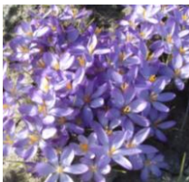
Whitewell Purple , Groblütiger Krokus

Er blüht früh mit blass lavendelblauen Blüten. Außen wirkt die Farbe silbrig. Er eignet sich gut zum verwildern.