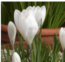
Jeanne d'Arc , Großblütiger Krokus

Der gelbe Krokus, auch Yello Mammoth genannt, ist pflegeleicht, blüht an seinem Standort belassen, jedes Jahr wieder und vermehrt sich schnell.