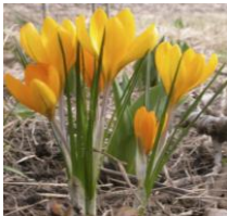
Yellow Mammoth , Großblütiger Krokus

In Steingärten und Rabattenrändern machen sich die weit geöffneten, weißgelben Blütensterne der Tulipa tarda besonders gut.