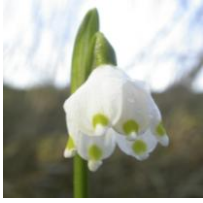
Leucojum aestivum , Knotenblume

Die Knotenblume läßt sich sehr gut verwildern und wird bis zu 40 cm hoch. An jedem Schaft hängen viele kleine, weiße Blüten. Sie blüht im Mai.