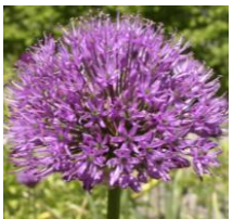
Allium aflatunense 'Purple Sensation' , Zierlauch

Der Neapolitanische Lauch ist eine 20 – 40 cm hohe mediterrane Lauchart mit schneeweißen Blüten. Ideal für den Steingarten und andere eher trockene, sonnige Standorte.