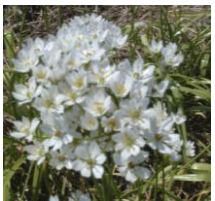
Allium neapolitanum , Neapolitanischer Lauch

Sehr imposante, sternförmige amethystfarbene Blütenkugeln, stehen im Juni/Juli auf bis zu 70 cm hohen Stielen. Die Blütenkugeln eignen sich hervorragend zum Schnitt und sind sehr lange haltbar