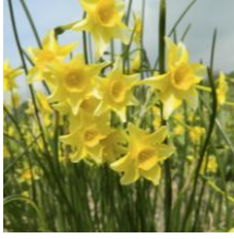
New baby , Tazetta Narzisse

Diese Mininarzisse ist eine zierliche reichblühende Schönheit mit zartem Duft. Sie freut sich über einen Platz am Rand oder als Unterpflanzung von Gehölzen und vermehrt sich dort fleißig.