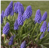
Muscari ameniicum , Traubenhyazinthe

Wunderschöne, tiefblaue, violette Blüten, die mit bis zu drei Glocken am Stängel stehen. Er blüht früh und wird gerne in Parks angepflanzt. Besonders an schattigen oder halbschattigen Standorten.