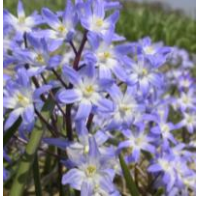
Chionodoxa forbesii , Schneestolz

Die Knotenblume läßt sich sehr gut verwildern und wird bis zu 40 cm hoch. An jedem Schaft hängen viele kleine, weiße Blüten. Sie blüht im Mai.