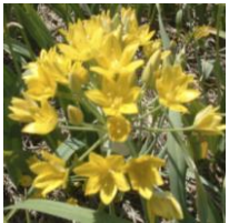
Allium moly 'Jeanine' , Gold-Lauch

Die Jonquilla Narzisse überrascht uns mit 2-3 wunderbar duftenden Blüten pro Stil. Die zitronengelben Blütenkränze tragen in der Mitte eine leuchtend orangefarbene Nebenkronen und strahlen um die Wette wie kleine Sonnen.