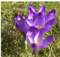
Ruby Giant , Großblütiger Krokus

Der Krokus mit reinweißen Blüten, ist die Gartenform von Crocus vernus , dem heimisch, auf Bergwiesen vorkommenden Frühlingskrokus.